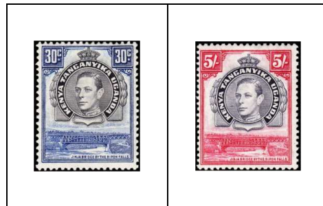
Pont Djindja sur les chutes du Ripon